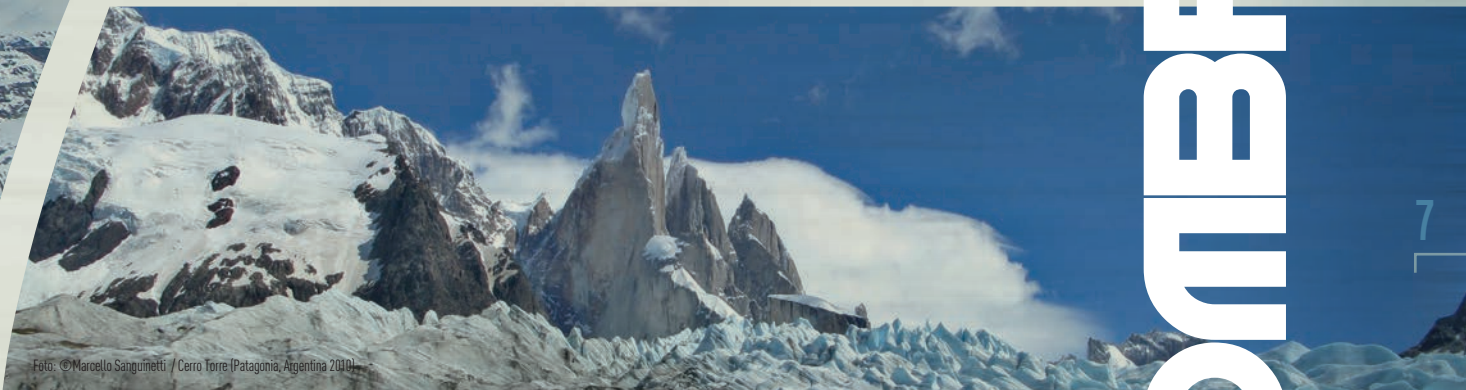
Cerro Torre (Patagonia, Argentina 2010)