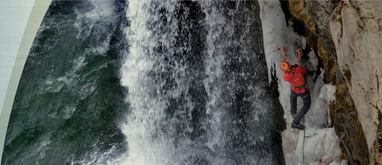
Cecilia Buil (Islandia 2011)