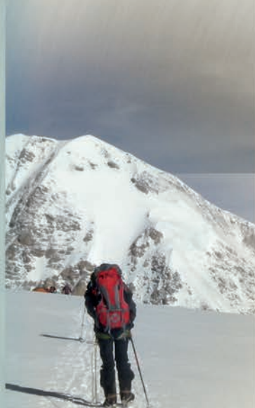
© Ismael García Arribas. Sisheta Pangma 2010.