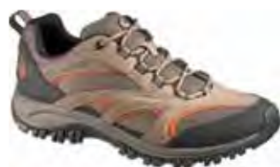
Phoenix Ventilator 41451