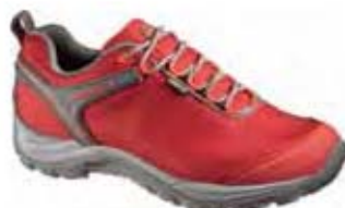
Chameleon 5 Storm GTX 39929