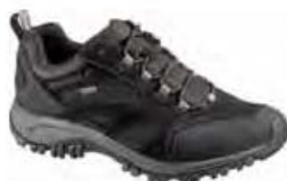
Phoenix Ventilator GTX 41445