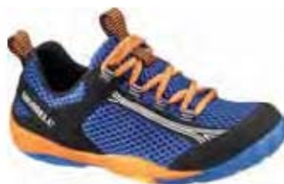
Flux Glove 96001