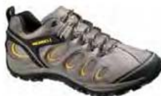
Chameleon 5 Ventilator 39939