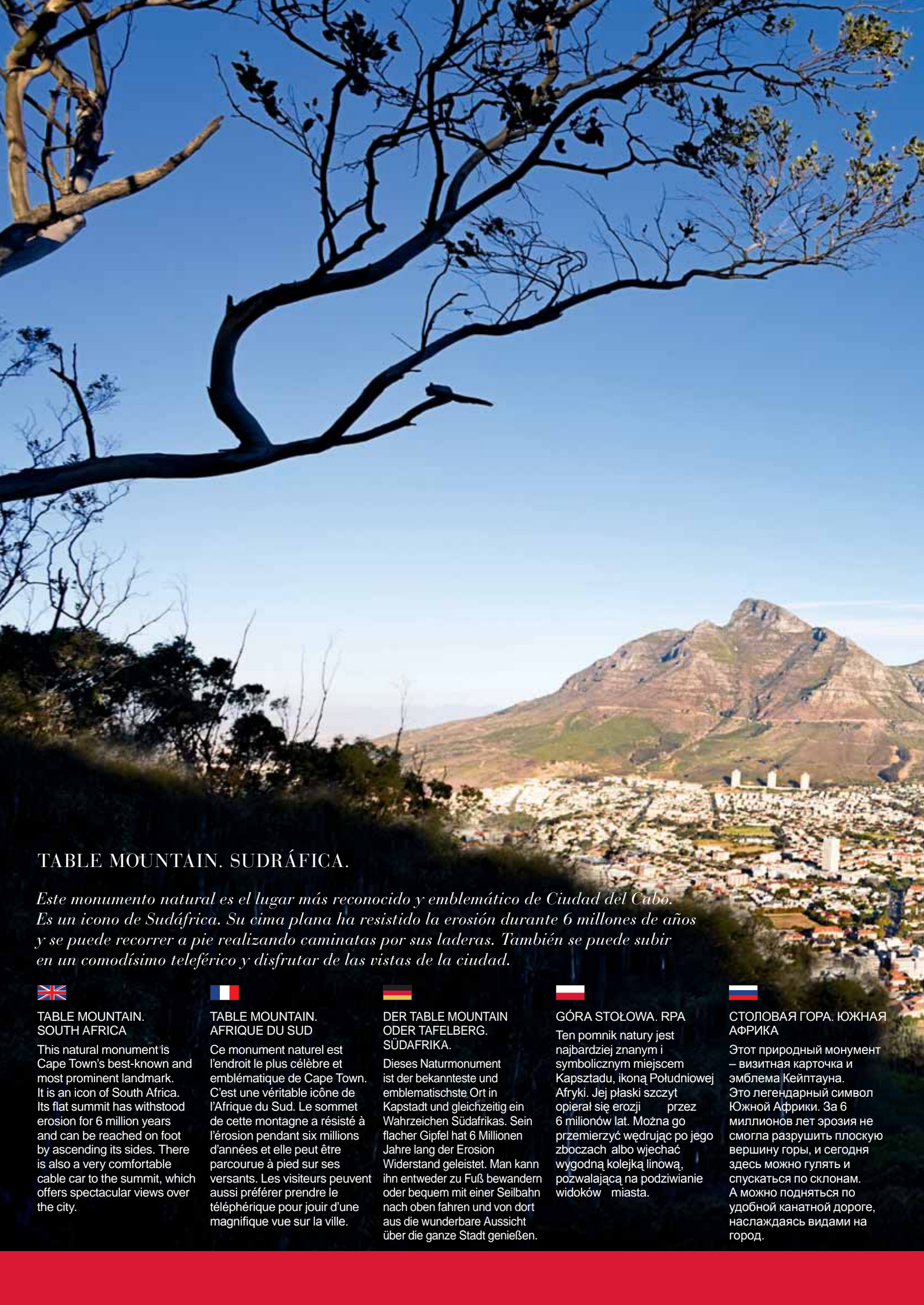
TABLE MOUNTAIN. SUDRÁFICA.

Este monumento natural es el lugar más reconocido y emblemático de Ciudad del Cabo. Es un icono de Sudáfrica. Su cima plana ha resistido la erosión durante 6 millones de años y se puede recorrer a pie realizando caminatas por sus laderas. También se puede subir en un comodísimo teleférico y disfrutar de las vistas de la ciudad.